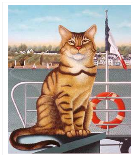
( Musée de la Mer : Paimpol.)

www.vercruyce.com www.artactif.com/vercruyce-bernard E-Mail : vercruyce@orange.fr